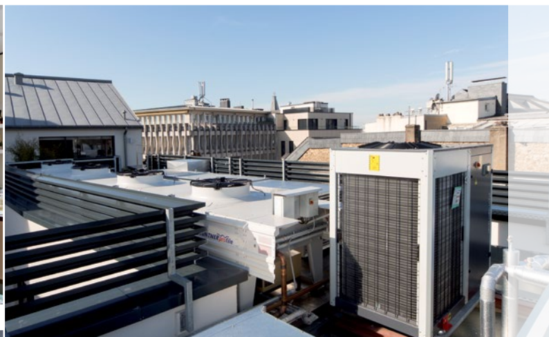
Équipement technique en toiture