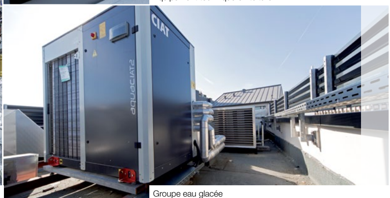
Groupe eau glacée

a+p kieffer omnitec sàrl s'est vu confier les travaux d'installation, mais a également en charge depuis janvier 2013, la conduite technique et énergétique, la surveillance et la maintenance curative des installations techniques HVAC et sanitaires.