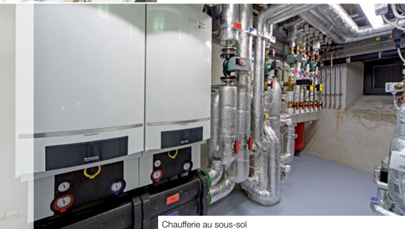
Chaufferie au sous-sol