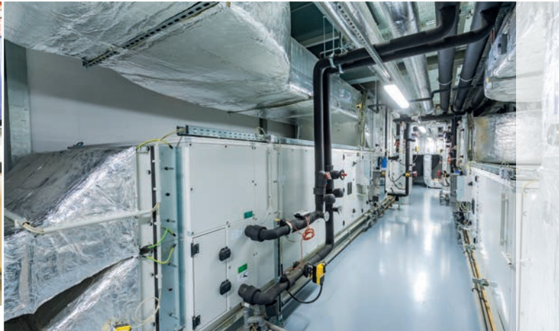
Groupe de ventilation - Bureaux