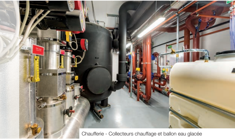
Chaufferie - Collecteurs chauffage et ballon eau glacée