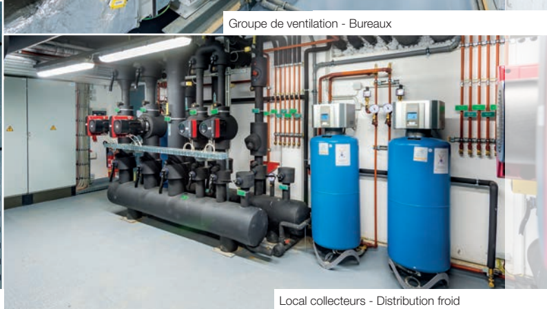
Local collecteurs - Distribution froid

L'eau de pluie est valorisée pour les réseaux d'arrosage des murs végétaux, des arrosages des plantations extérieures et des alimentations des WC. Le bâtiment est certifié BREEAM.